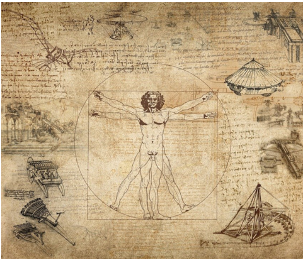
@pixabay- Homme de Vitruve (Leonard)

UNE ACTIVITE A LA FOIS VALORISEE ET FLOUE. La notion d'ingénierie est très valorisée en contexte professionnel dans l'espace francophone, notamment depuis le milieu du 20ème siècle. Se substituant au terme de génie, elle réussit la performance de susciter à la fois des connotations scientifiques/rationnelles ordonnées autour de la notion de 'progrès', et des connotations relatives à une approche globale, contextualisée, singulière de l'action.