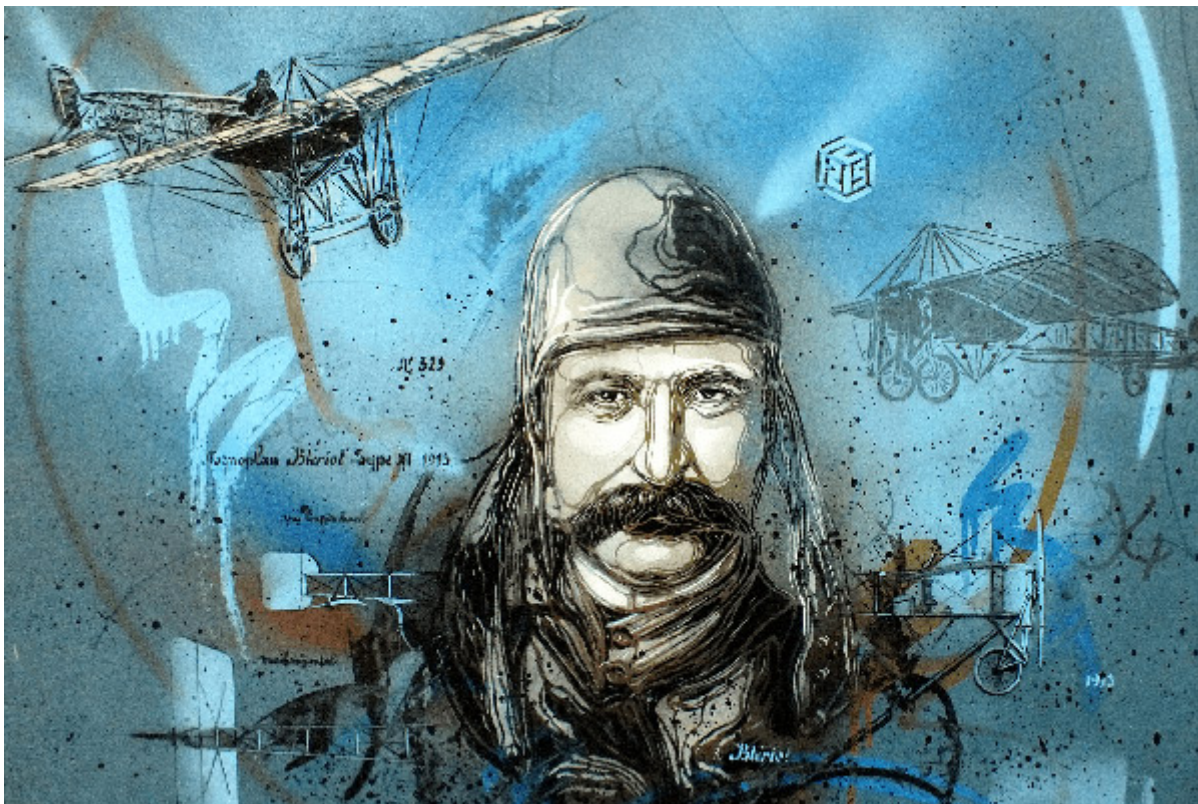
Louis Blériot par C215

Ça aurait pu être l'une des questions du jeu des milles francs. « Lucette, de Bois-plage, vous demande qui fut l'homme de l'année 1909 : Eugène Schueller, créateur de la Société française de teintures inoffensives pour cheveux, devenue L'Oréal ; Robert Edwin Peary, premier homme à atteindre le pôle Nord ; ou Henri Poincaré, reçu à l'Académie française pour ses travaux scientifiques ? » Malgré l'aide appuyée du premier rang, les deux candidats, bercés par la mélodie du métallophone, seraient certainement restés cois.